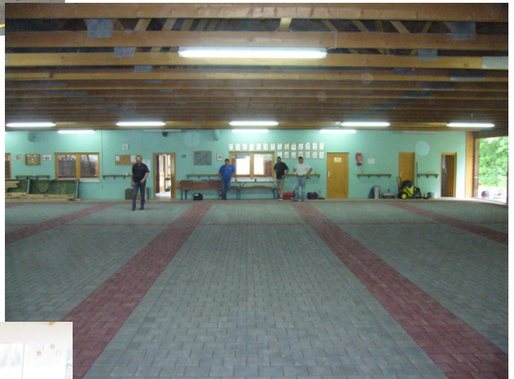
7-Bahnenhalle (Pflaster) in D-94447 Plattling