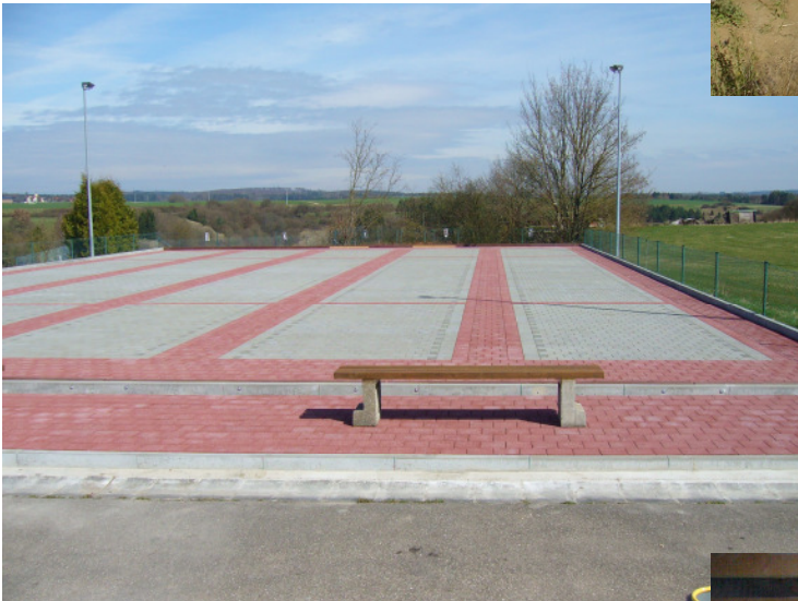
5-Bahnenanlage (Pflaster) in D-93336 Altmanstein