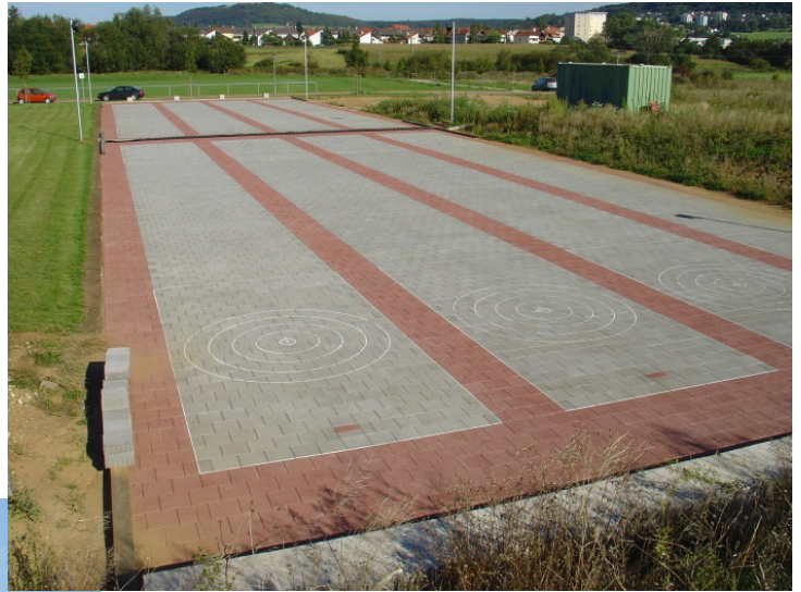
8-Bahnenanlage (Pflaster) in D-91781 Weißenburg