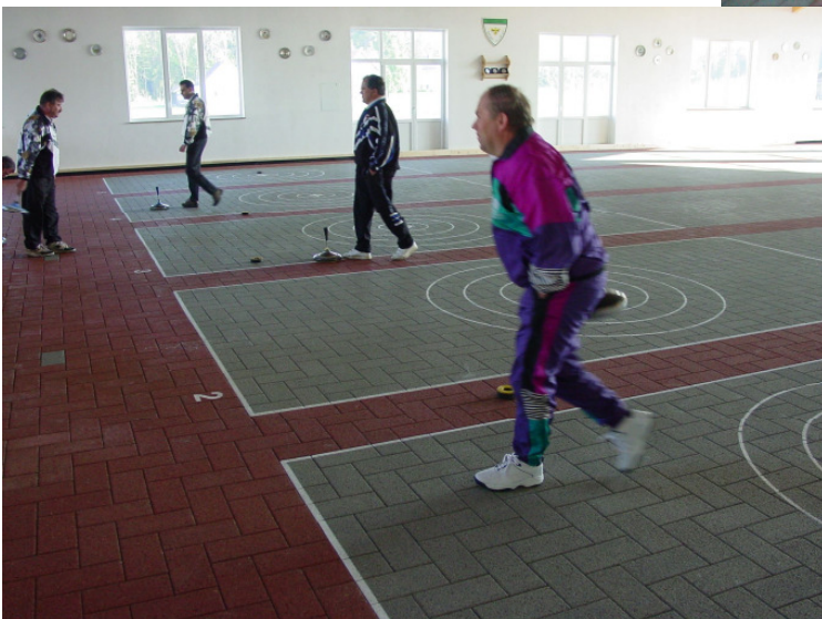
5-Bahnenhalle (Pflaster) in 85416 Langenbach-Oberhummel