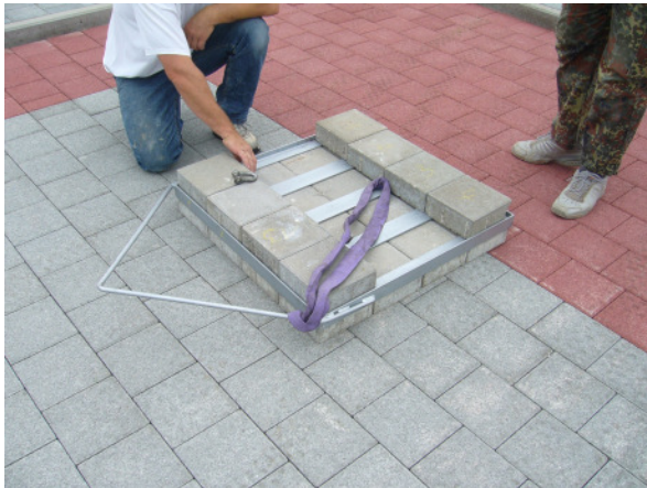
Detail der „Schleifvorrichtung“

4 Pflasterstockbahnen in der Stockhalle des SC Zell