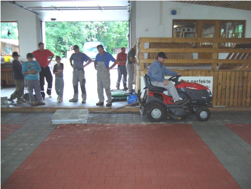
„Abziehen bzw. schleifen“ der Bahnen in Zell