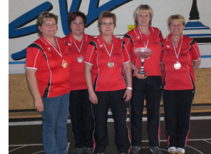
ESV Losenstein Rang 3

Veranstaltung UNTERLIGA OST DAMEN SOMMER 2008 Veranstalter Landesverband OÖ Durchführer Bezirk 1 Linz Austragungsort Halle Lichtenberg Datum 20.04.2008