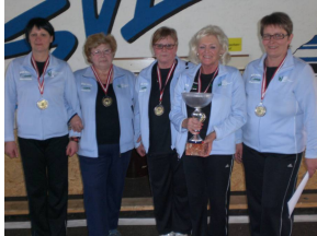
ESV ASKÖ eisbär Marchtrenk Rang 1