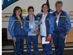
ASKÖ Schiffswerft Rang 2